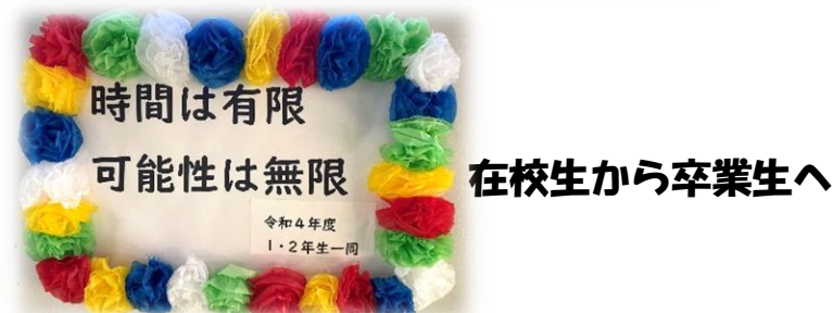
在校生から卒業生へ