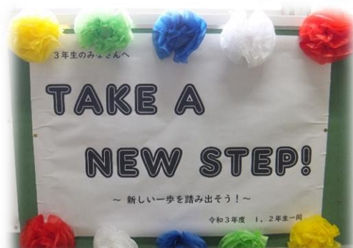
1・2年生から3年生へ