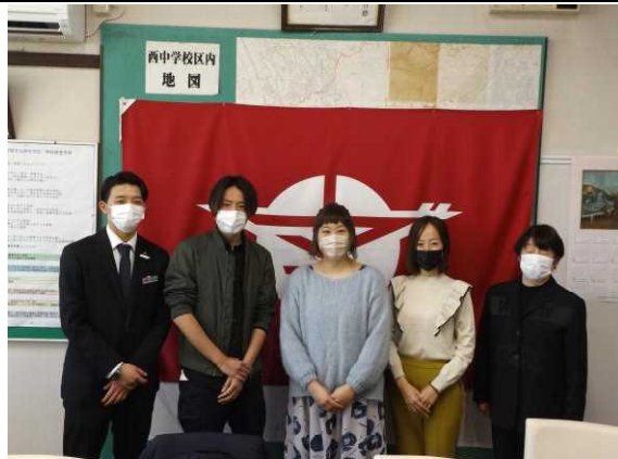
2年生職業講話の講師の先生方

そのほかにも、毎月あいさつ運動に参加して下さる、青少年指導員、青少年補導員、座間警察署少年補導員の皆様、地域の相談役になって下さる、民生委員・児童委員の皆様、通学路の安全を見守って下さる交通指導員の皆様、お祭りや行事の場を提供して下さる自治会の皆様。西中の応援団として、校舎の補修やペンキ塗りなどをしてくださっている、おやじの会「かけはし」の皆様、2年連続中止になりましたが、大風祭りでお世話になる大風保存会の皆様。などなど。私たちが暮らす地域では本当に多くの方々为学校や生徒を支えてくださっています。本当にありがたく思います。