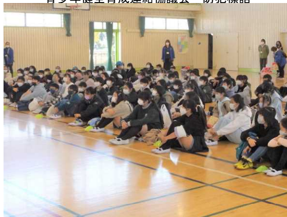
青少年フェスティバル