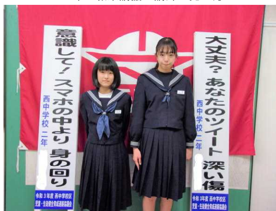
青少年健全育成連絡協議会 防犯標語