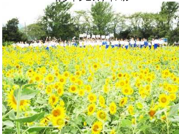
西中伝統のひまわり畑